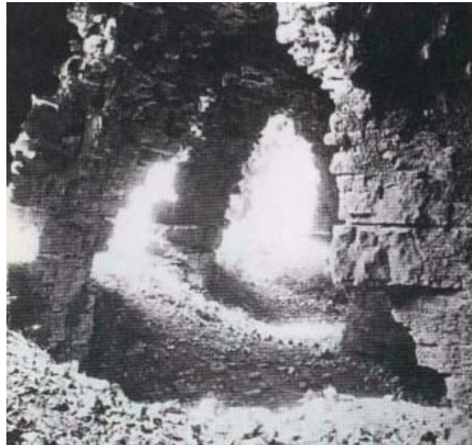
Die Eingänge zur Drakenhöhle im Stadtmauersteilhang. Der Kalk riss an den Bergflanken durch Hangrutschungen kluffartig auf; Wasser wusch die Klüfte aus und erweiterte sie zu Spaltenhöhlen. Die längste Höhle soll als Gang bis unter das alte Rathaus führen.

Die Markierung x leitet durch die Fußgängerzone der Stadt im Tal und dann zur Stadt auf dem Berg. Es sind grundverschiedene Städte: unten die lebhafteste Stadt, oben die Bergstadt mit Felswänden, Höhlen, auffälliger Ruhe und einem enormen Blick über das bergige Land. Der Wechsel kündigt sich an, wenn x bei der Antoniuskapelle die Bülbergstraße verlässt und in den Steilhang tritt.